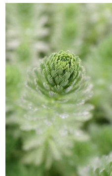
HALORAGACEAE Myriophyllum aquaticum