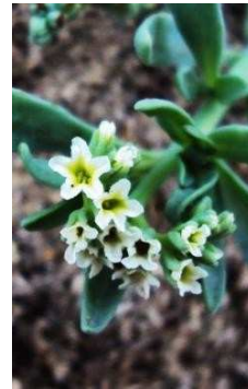
BORAGINACEAE Heliotropium curassavicum “Colita de escorpión”