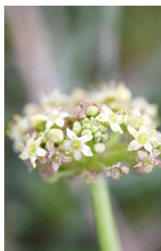
ARALIACEAE Hydrocotyle sp. “Paraguaita”