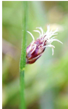
CYPERACEAE Schoenoplectus americanus “Junco”