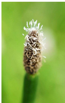
CYPERACEAE Eleocharis intersticta “Velita de Santa Rosa”