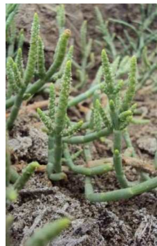
AMARANTHACEAE Salicornia fruticosa “Salicornia”