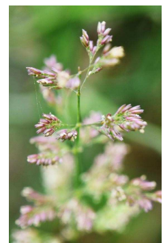
POACEAE Polypogon viridis