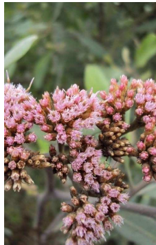
ASTERACEAE Tessaria integrifolia “Pájaro bobo”