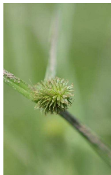
CYPERACEAE Kyllinga brevifolia