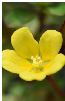
ONAGRACEAE Ludwigia sp.