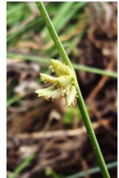
CYPERACEAE Cyperus laevigatus “Junquillo”