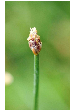
CYPERACEAE Eleocharis geniculata “Velita”