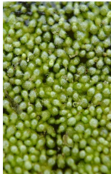
ARACEAE Wollfia columbiana