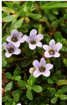
PLANTAGINACEAE Bacopa monnieri