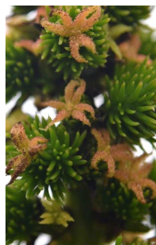
EUPHORBIACEAE Ricinus communis “Higuerilla”