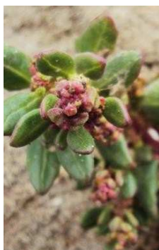
AMARANTHACEAE Chenopodium sp.