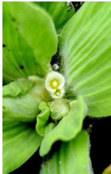
ARACEAE Pistia stratiotes “Repollito de Agua”