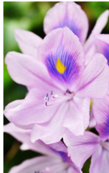
PONTEDERIAACEAE Eichhornia crassipes “Jacinto de agua”