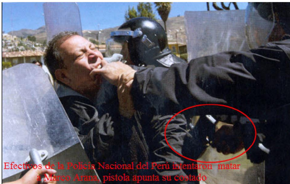
Efectivos de la Policía Nacional del Perú intentaron matar a Marco Arana, pistola apunta su costado

Publicada el 07 de julio de 2012 en la Revista SOMOS N° 1335 de El Comercio.