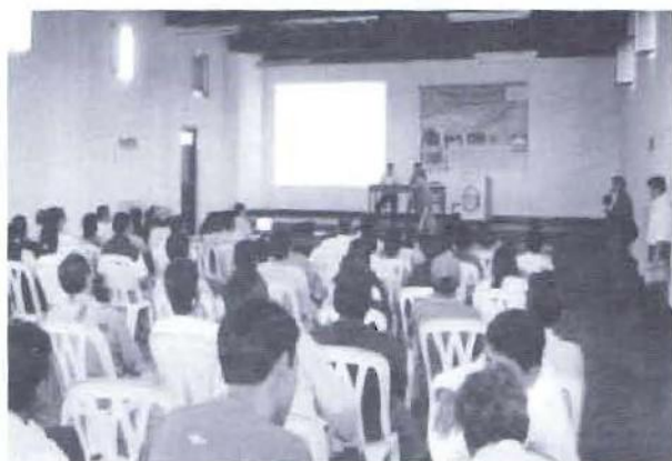
En pleno taller de capacitación para el proceso