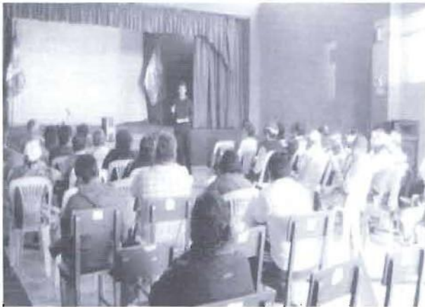
Agentes participantes en el taller de apertura del proceso en el distrito de Paramonga.