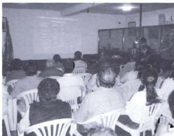
Exposición motivadora sobre el proceso a cargo de Cooperación.