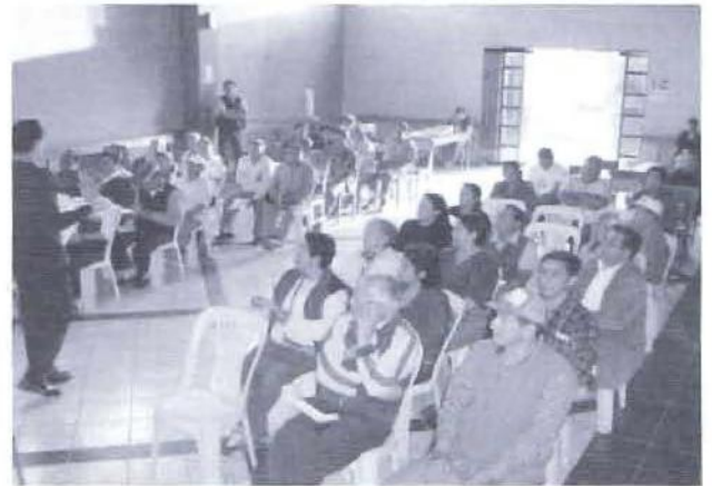
La participación de la población del distrito fue significativa