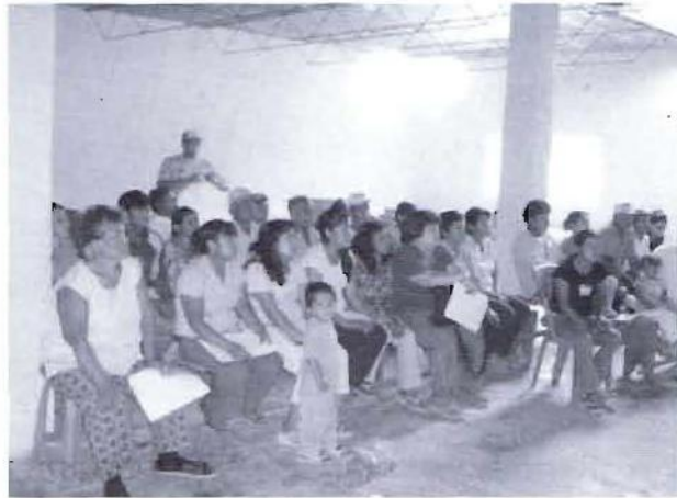
Taller descentralizado en Caral, una de las siete zonas en que fue estratégicamente dividido el distrito para la formulación del Plan de Desarrollo