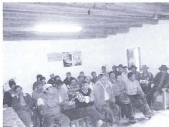
En pleno taller de capacitación para el proceso