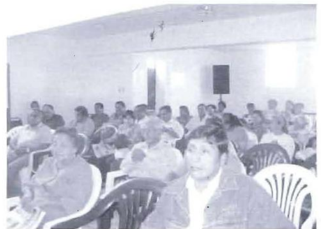
El proceso participativo de actualización del PDC concitó expectativas en la población de Hualmay