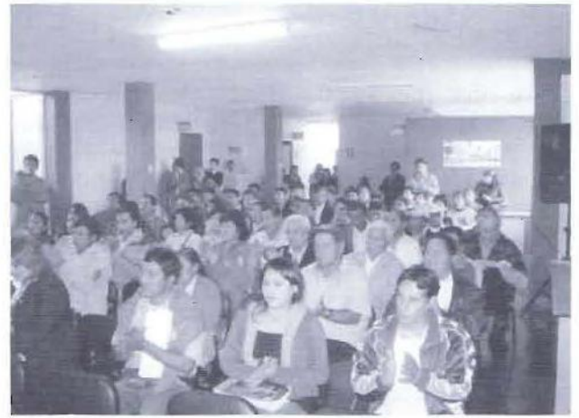
Uno de los talleres de capacitación del presupuesto participativo en la provincia Barranca.