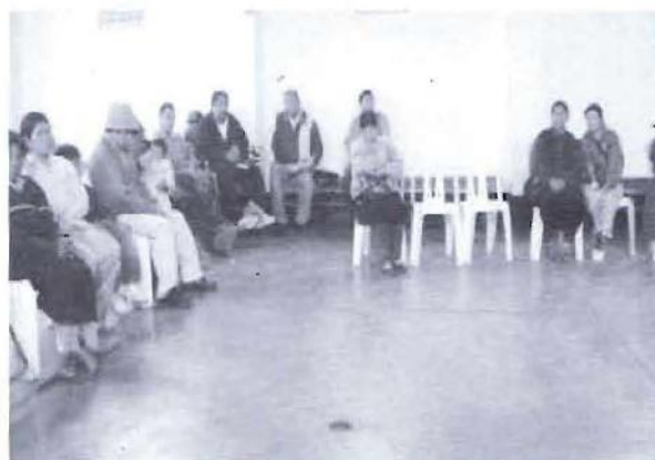
Las organizaciones de discapacitados también se involucraron en el proceso de Presupuesto Participativo