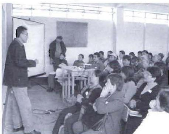
Funcionario de la municipalidad provincial explicando el proceso de Presupuesto Participativo.