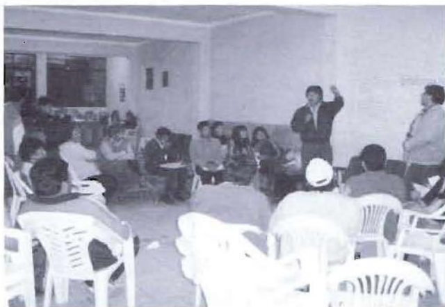
En pleno taller de validación y ajuste del PDC. El proceso concitó una gran expectativa y compromiso de la población, y sirvió como un espacio para la expresión y conciliación de intereses ciudadanos.