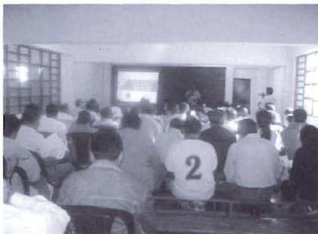
Taller de capacitación en el marco del proceso de actualización del PDC. Creemos que la capacitación constante es una de las estrategias para hacer sostenible la gestión del desarrollo local.