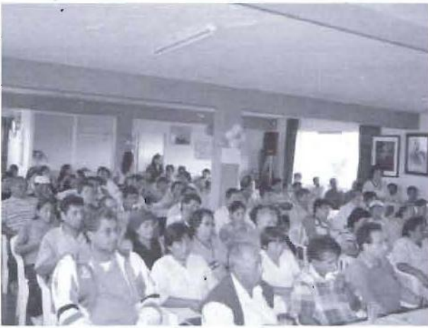
Agentes participantes en el taller de apertura del presupuesto participativo en la provincia de Barranca.