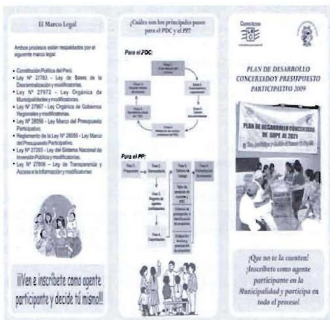
Tríptico informativo sobre el proceso de PDC y PP elaborado por CooperAcción para dar soporte a los procesos participativos acompañados

Por su parte, en la provincia de Huaura hemos acompañado la actualización del plan de desarrollo del distrito de Sayán y nos preparamos, ya concluido el presupuesto participativo, a actualizar los planes de desarrollo, tanto de ambas provincias como de sus distritos.