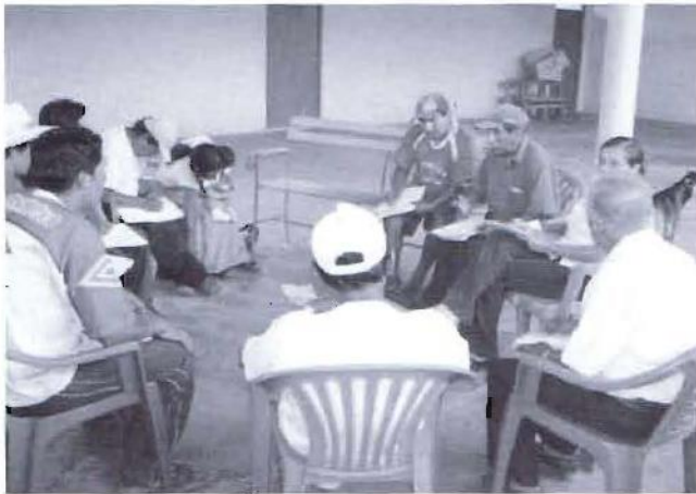
Taller descentralizado de formulación del PDC en la zona de Venado Muerto