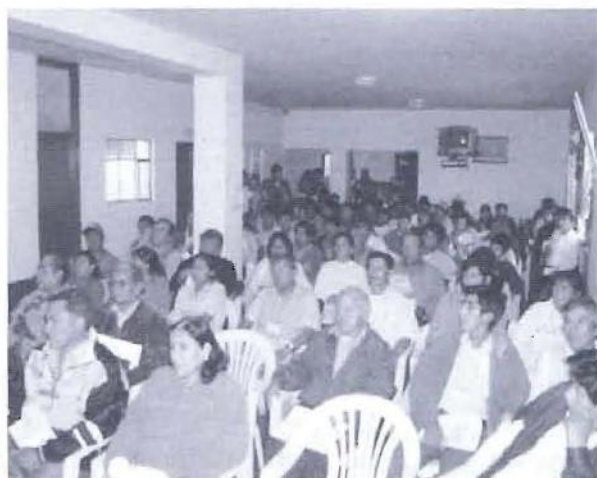
Agentes participantes en el taller de apertura del proceso en el distrito de Végueta.