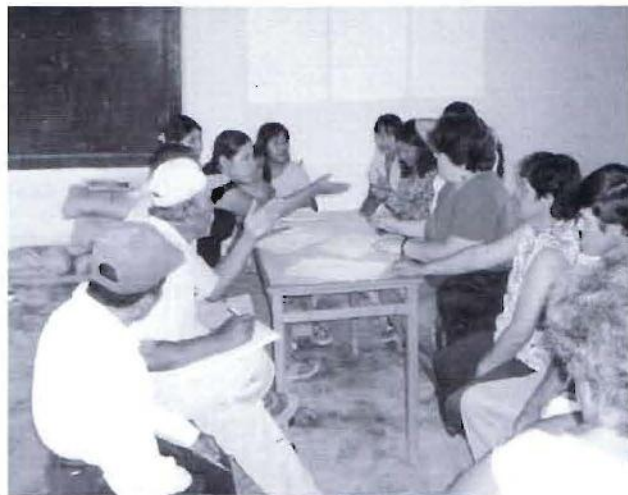
Población de Caral en el distrito de Supe en pleno taller descentralizado de elaboración del PDC

probablemente haya contribuido a que el distrito tenga las peores cifras en términos de pobreza y desarrollo humano, según lo señalan los informes del FONCODES y el PNUD, respectivamente.