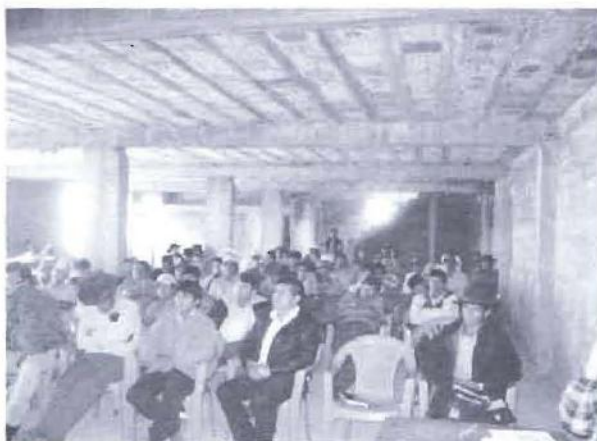
Taller de Presupuesto participativo en una de las zonas del distrito de Leoncio Prado