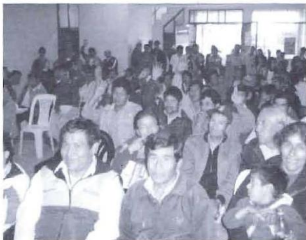
El presupuesto participativo en Supe concitó una amplia participación y expectativa de la población