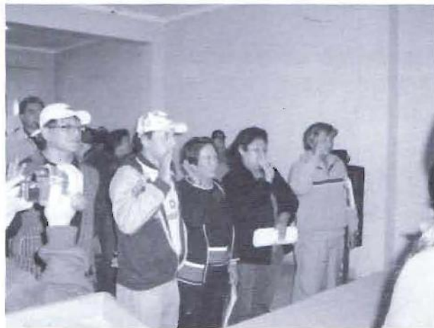
Miembros del Comité de Vigilancia y Control tomando juramento ante el alcalde del distrito.