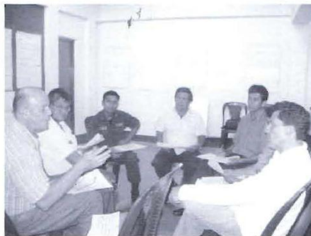
La actualización del PDC ha puesto en evidencia la necesidad de fortalecer los espacios de diálogo entre ciudadanos para la generación de consensos locales.