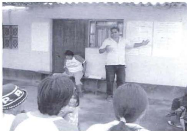
Miembro del CCL en plena facilitación. El proceso sirvió también para desarrollar capacidades de la sociedad civil supana para que sea protagonista y asuma su responsabilidad en la elaboración del PDC.