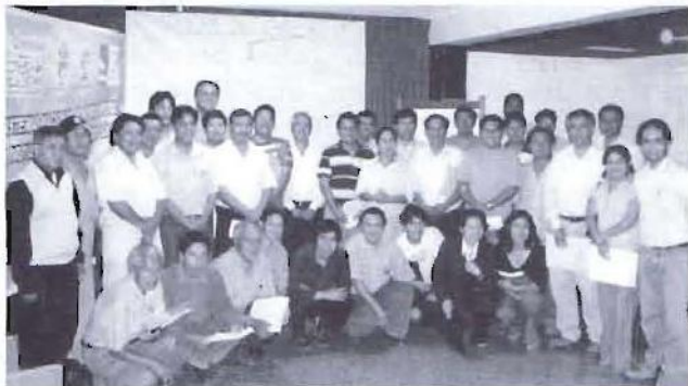
Participantes del curso desarrollado en la provincia de Barranca

Uno de los componentes de nuestro proyecto está relacionado con el fortalecimiento de capacidades para la mejora de la gestión local. Con ello buscamos no sólo contribuir a la adquisición de nuevos conocimientos, sino fundamentalmente contribuir a la mejora de los desempeños, destrezas, y competencias para la gestión. Pero ello no implica centrar nuestro trabajo solamente con funcionarios y autoridades, sino también con la población organizada, pues en efecto, la gestión del desarrollo local es un esfuerzo que demanda del compromiso potente de todos los actores locales.