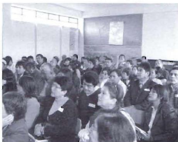
El proceso de Presupuesto Participativo en la provincia tuvo una amplia participación.