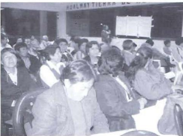
Agentes participantes en pleno taller de actualización del Plan de Desarrollo Concertado en el marco del presupuesto participativo