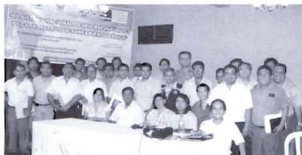
Participantes del curso desarrollado en la provincia de Huaura

Esta importante actividad, junto a otras a desarrollarse próximamente, busca fortalecer las capacidades locales de equipos técnicos municipales. Próximamente iniciaremos un programa de capacitaciones y formación dirigida especialmente a la sociedad civil, de tal manera que este binomio de actores tenga un mejor desempeño en los procesos participativos locales para la articulación adecuada de sus planes de desarrollo y sus recursos locales, como estrategia para enfrentar adecuadamente la lucha contra la pobreza.