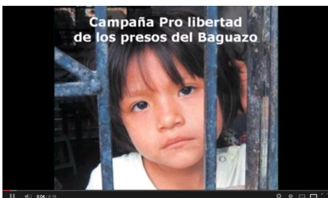
Video “Campaña Pro libertad de los Presos del Baguazo”

Son muchas las organizaciones que, desde diversos frentes, vienen trabajando en la defensa de los nativos. CooperAcción, en su afán de hacer prevalecer la verdad y la justicia sobre los lamentables sucesos de la curva del diablo, apoya la “Campaña Pro Libertad de los Presos del Baguazo”, que se inició en febrero pasado con la publicación del boletín informativo “Una Herida Abierta” .