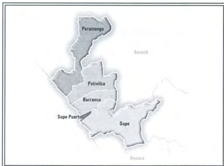
Mapa de la provincia de Barranca

Los límites geopolíticos de la provincia de Barranca son: por el norte con las provincias de Bolognesi y Huarney (departamento de Ancash); por el sur con la provincia de Huaura, por el este con la provincia de Ocros (departamento de Ancash) y por oeste con el Océano Pacífico. La provincia de Barranca posee una superficie de 1,355.87 km 2 , y su densidad poblacional es de 98.7 hab/km 2 . La provincia está constituida por 5 distritos: Barranca, Supe, Supe Puerto, Pativilca y Paramonga. Para llegar a ella el acceso y vía principal es la carretera Panamericana Norte, la cual mantiene un flujo constante entre la zona y Lima, Ancash y los departamentos de la costa norte. Hacia el interior de los distritos existen vías asfaltadas, afirmadas y trochas que unen las áreas agrícolas con la carretera principal, es también el ingreso a la ciudad de Huaraz, por la vía Lima-Pativilca-Huaraz de 408 Km. Existe acceso por el mar, que se concreta con el muelle en la Bahía de Supe Puerto.