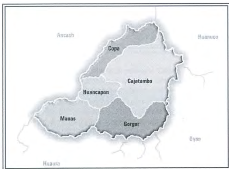
Mapa de la provincia de Oyón

La provincia de Cajatambo limita al norte con el departamento de Áncash, al este con el departamento de Huánuco, al sur con la provincia de Oyón y al oeste con la provincia de Huaura. Está ubicada en la parte occidental de la cordillera de los Andes, a 3350 msnm. Su extensión territorial es de 1.515.21 km 2 . La parte más baja de su jurisdicción corresponde al puente Cahua (850 msnm) y la más alta al nevado Huacshash (5.654 msnm). Sus coordenadas son 10°20'08"S 76°50'03"O-10.33556, -76.83417. Es la provincia menos poblada del norte chico con un total de 8,358 habitantes que corresponde al 0.9% del total de la población de la región. Es una provincia netamente andina y está conformada por cinco distritos: la capital Cajatambo, Copa, Huancapón, Gorgor y Manas.