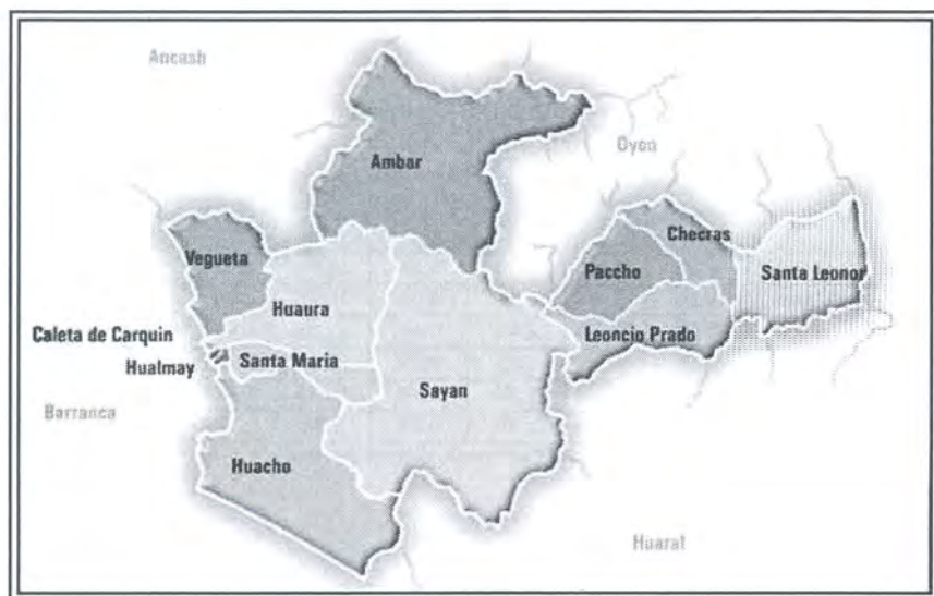
Mapa de la provincia de Huaura

La provincia de Huaura se encuentra ubicada al norte del departamento de Lima, aproximadamente a 140 km al norte de la ciudad de Lima. Geográficamente se localiza entre las coordenadas UTM 204 472 E, 8 733 770 N y 328 697 E, 8 826 086 N. Los límites geopolíticos de la provincia de Huaura son: por el norte con las provincias de Barranca, Cajatambo y Oyón (departamento de Lima) y Ocos (departamento de Ancash); por el sur con la provincia de Huaraz, por el este con la provincia de Pasco (departamento de Pasco) y por oeste con el Océano Pacífico. La provincia de Huaura posee una superficie de 4892,52 km 2 y está constituida por 12 distritos: Ámbar, Caleta Carquín, Checras, Huacho, Hualmay, Huaura, Leoncio Prado, Paccho, Santa Leonor, Santa María, Sayán y Végueta. Al igual que la provincia de Barranca, para acceder a Huaura la vía principal es la carretera Panamericana Norte, de flujo constante entre la provincia y Lima y los departamentos de la costa norte. Hacia el interior de los distritos existen vías asfaltadas, afirmadas y trochas que unen las áreas agrícolas con la carretera principal. Existe acceso por el mar, que se concreta con el muelle en las bahías de Huacho y Caleta Carquín.