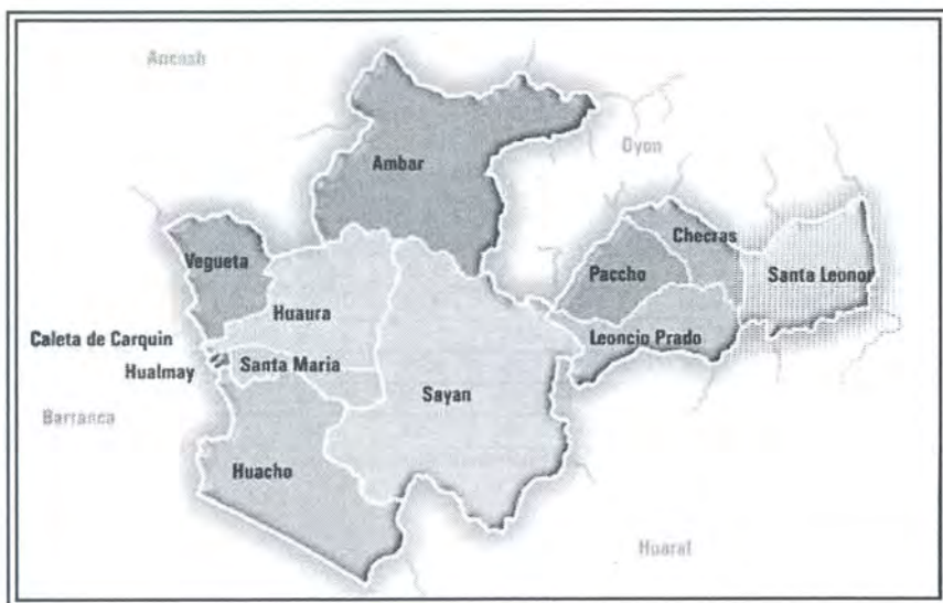
Mapa de la provincia de Huaura

La provincia de Huaura se encuentra ubicada al norte del departamento de Lima, aproximadamente a 140 km al norte de la ciudad de Lima. Geográficamente se localiza entre las coordenadas UTM 204 472 E, 8 733 770 N y 328 697 E, 8 826 086 N. Los límites geopolíticos de la provincia de Huaura son: por el norte con las provincias de Barranca, Cajatambo y Oyón (departamento de Lima) y Ocos (departamento de Ancash); por el sur con la provincia de Huaraz, por el este con la provincia de Pasco (departamento de Pasco) y por oeste con el Océano Pacífico. La provincia de Huaura posee una superficie de 4892,52 km 2 y está constituida por 12 distritos: Ámbar, Caleta Carquín, Checras, Huacho, Hualmay, Huaura, Leoncio Prado, Paccho, Santa Leonor, Santa María, Sayán y Végueta. Al igual que la provincia de Barranca, para acceder a Huaura la vía principal es la carretera Panamericana Norte, de flujo constante entre la provincia y Lima y los departamentos de la costa norte. Hacia el interior de los distritos existen vías asfaltadas, afirmadas y trochas que unen las áreas agrícolas con la carretera principal. Existe acceso por el mar, que se concreta con el muelle en las bahías de Huacho y Caleta Carquín.